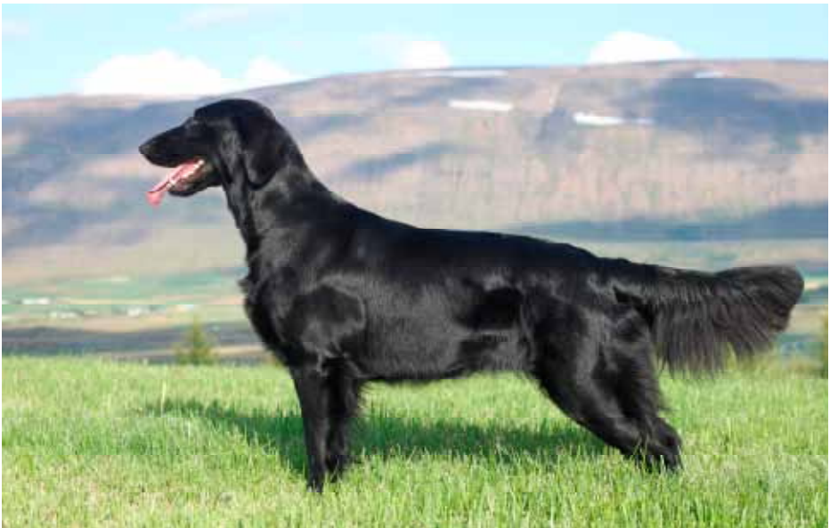
Flat coated Retriever

Fyrst missir hann tvær miðjuframtennur í efri gómi og síðan fara þær 2 og 2 á u.þ.b. 14 daga fresti. Vígtennurnar missir hann ekki fyrr en hann er um 5 mánaða gamall en nýjar tennur koma mjög fljótt í staðinn.