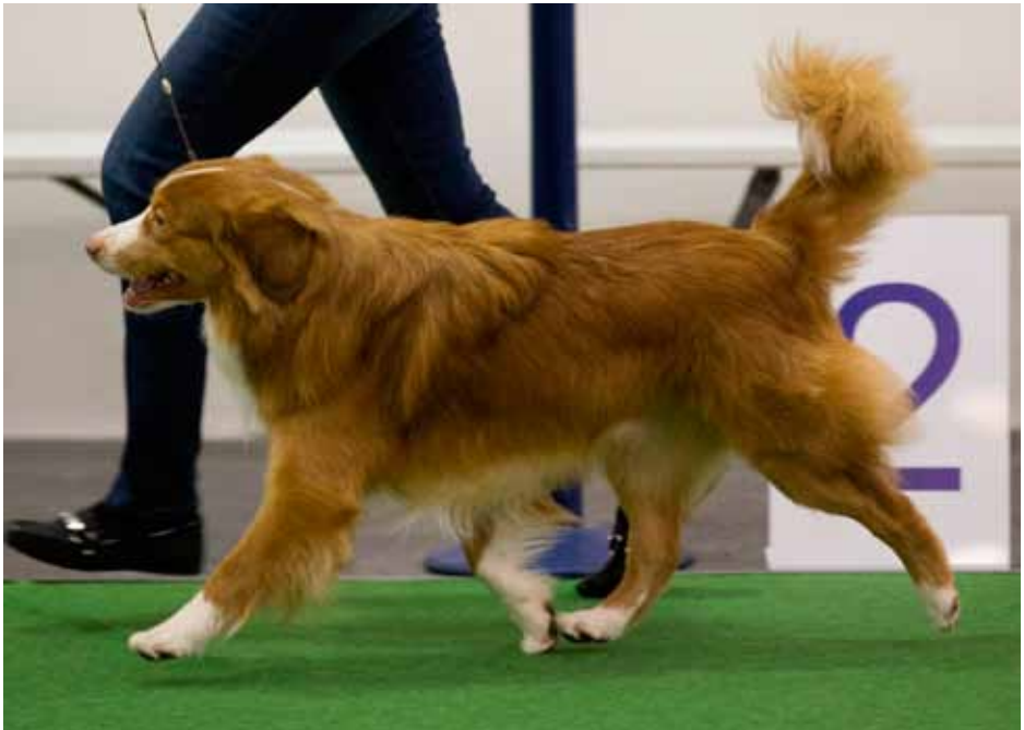
Nova scotia Duck Tolling Retriever

Nagbein, kálfsleggir eða hörð bökuð nagbein eru frábær hjálpartæki til að tannskiptin gangi vel fyrir sig. Vertu samt vel á verði gagnvart föstum hvolpatönnum og ef þú ert ekki viss um að allt sé í lagi leitaðu þá ráða hjá dýralækninum.